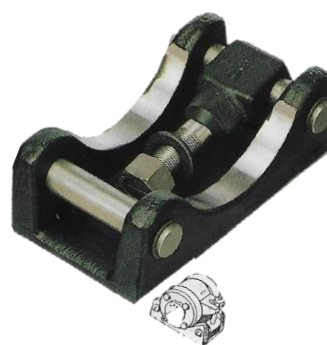
FRB2 : petit berceau