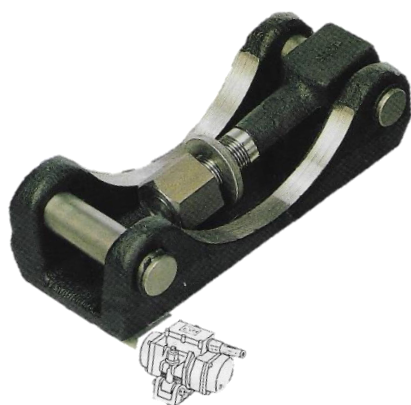
FRB4 : grand berceau

Pour turbo vibrateurs pneumatiques série VEP et pour vibrateurs électriques série EAHF/B et EA/B